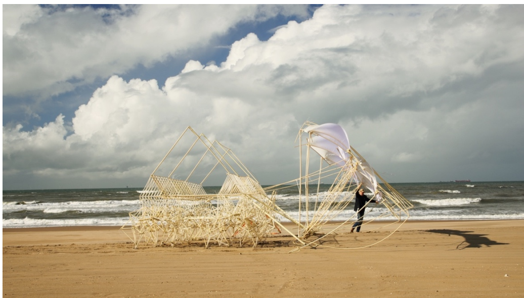
Escultura cinètica Strandbeest

Una obra que no deixarà ningú indiferent és la impressionant escultura cinètica de grans dimensions Strandbeest , de Theo Jansen , una performance a càrrec de tota una obra d'enginyeria que es mou imitant el pas dels organismes vius aprofitant la força del vent i que es passejarà per CAN REON en diferents moments del festival .