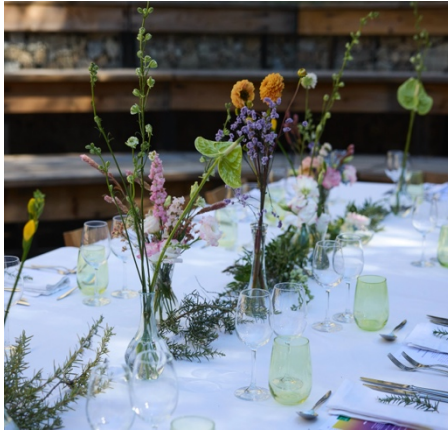
Wild wild menu, de Sami Tallberg