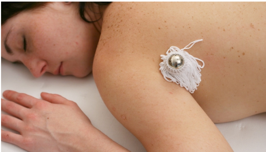
Robot Tickle Salon 2.0.

Una altra de les propostes que, de ben segur, també generarà molt interès entre els assistents és el Tickle Salon 2.0. de Driessens & Verstappen , un robot de carícies. Aquesta instal·lació artística interactiva permet els assistents tombar-se i gaudir d'una placenta sessió de carícies de 15 minuts en què la persona pot anar indicant al robot aquelles que li resulten més agradables mitjançant un comandament de dos botons, informació que el robot utilitzarà per personalitzar l'experiència.